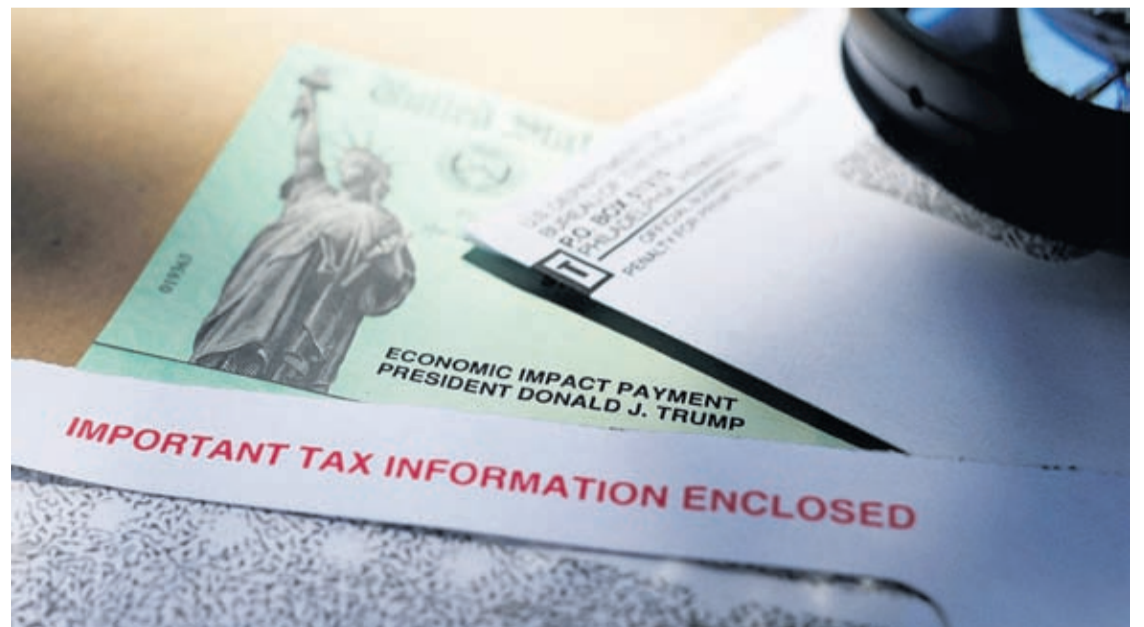
In this April 23, 2020, file photo, President Donald Trump's name is seen on a stimulus check issued by the IRS to help combat the adverse economic effects of the COVID-19 outbreak, in San Antonio.